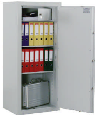
Art.-Nr. 35108 und Art.-Nr. 35123

Versicherungsschutz: Priv. bis € 40.000,- / gew. bis € 10.000,- (unverbindliche Richtwerte, sprechen Sie mit Ihrer Versicherung). Durch Ausführung nach VDMA 24992 Sicherheitsstufe B Ausgabe Mai 95. Allseitig doppelwandiger Korpus.Tür doppelwandig 78 mm stark mit dreiseitig Verriegelung durch Schliessbolzen mit 25 mm Durchmesser und starren Bolzen auf der Schamierseite. Hochwertige Feuerisolierung, umlaufender Feuerfalz. Auf Wunsch wird auch ein Innentresor eingeschweißt (gg.Mehrpreis). Gegen Mehrpreis mit mechanischem Zahlenschloss bzw. Elo-Schloss. Grundausrüstung: DB-Schloss VdS-Klasse I mit 2 Schlüsseln (Schlüssellänge 65mm), Türöffnungswinkel 180°, Hängegriff Metall, 60mm vorstehend, Riegelwerk, je 2 Bohrungen 11mm Rückwand und Boden (Schrank muss verankert werden), Verankerungsmaterial gg. Mehrpreis - siehe Zubehör; Lackierung/Farbe: RAL 7035