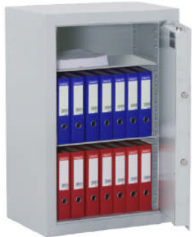
Abb. Art.-Nr. 35011 DB-Standardschloss

Versicherungsschutz: privat bis € 40.000,- / gew. bis € 10.000,- (bei fachger. Montage gem. Bedienungsanl.). Unverbindliche Richtwerte, sprechen Sie mit Ihrer Versicherung. Begrenzter Einbruchschutz und Schutz gegen leichte Brände. Alls. doppelw. Korpus und Tür; umlaufender Feuerfalz und feuerhemmende Isolierung in den Wandungen. Auf Wunsch (gg. Mehrpreis) ist auch ein Innentresor lieferbar. Gegen Mehrpreis auch mit mech. Zahlen- bzw. Elektronenschloss. Grundausrüstung: DB-Schloss VdS-Klasse I mit 2 Schlüsseln (Schlüssellänge 65mm), Türöffnungswinkel 90°, Klappgriff Kunststoff schwarz, 12mm vorstehend, Riegelwerk, je 2 Bohrungen 11mm Rückwand und Boden (Schrank muss verankert werden), Verankerungsmaterial gg. Mehrpreis - siehe Zubehör; Lackierung/Farbe: RAL 7035