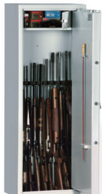
auch mit Sondereinrichtung - wie hier als Waffenschrank - mögl.