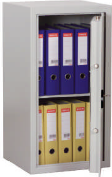
Art. Nr.: 33205 mit DB-Standardschloss

Versicherungsschutz: bis € 5.000,- (bei fachgerechter Montage gem. Bedienungsanleitung). Unverbindliche Richtwerte, sprechen Sie mit Ihrer Versicherung. Korpus, flammgeschützt, einwandig 3mm stark. Tür doppelwandig mit umlaufender Feuerfalz. Türblatt 6mm stark. Grundausrüstung: DB-Schloss VdS-Klasse I mit 2 Schlüsseln (Schlüssellänge 65mm), Türöffnungswinkel 90°, bis Art. 33201 flächenbündig ohne Riegelwerk, ab Mod. 33202 Klappgriff Kunststoff schwarz, 12mm vorst., Riegelwerk, je 2 Bohrungen 11mm Rückwand und Boden (Schrank muss verankert werden), Verankerungsmaterial gg. Mehrpreis - siehe Zubehör, Lackierung/Farbe: RAL 7035