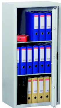
Art.-Nr. 33210 mit DB-Standardschloss

Versicherungsschutz: bis € 5.000,- (bei fachgerechter Montage gem. Bedienungsanleitung). Unverbindliche Richtwerte, sprechen Sie mit Ihrer Versicherung. Korpus, flammgeschützt, einwandig 3 mm stark. Tür doppelwandig mit umlaufender Feuerfalz. Türblatt 6 mm stark. Die Schränke ab 1500 mm Höhe sollten unbedingt wegen Kopflastigkeit bei geöffneter Tür verankert werden! Grundausrüstung: DB-Schloss VdS-Klasse I mit 2 Schlüsseln (Schlüssellänge 65mm), Türöffnungswinkel 90°, Klappgriff Kunststoff schwarz, 12mm vorst., Riegelwerk, je 2 Bohrungen 11mm Rückwand und Boden (Schrank muss verankert werden), Verankerungsmaterial gg. Mehrpreis - siehe Zubehör, Lackierung RAL 7035