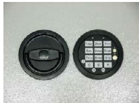
Art. Nr.: 33221