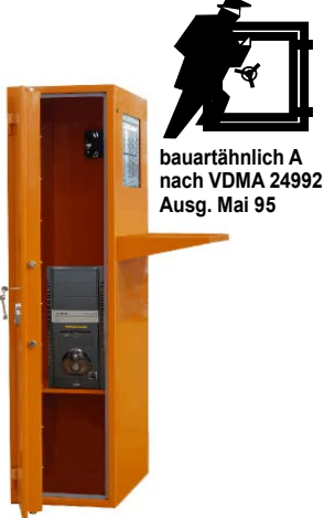
bauartähnlich A nach VDMA 24992 Ausg. Mai 95

Versicherungseinstufung: sprechen Sie mit Ihrer Versicherung. Bauartähnlich Sicherheitsstufe A nach VDMA 24992 Ausgabe Mai 95. Korpus 1-wandig 3 mm, Tür doppelwandig 70 mm, mit 3-seitiger Verriegelung über DB-Schloss mit 2 Schlüsseln. Serienmässige Lüftungsschlitze in der Tür mit Luftfilter vermeiden das Eindringen von Staub. Der serienmässige Ventilator (230 V) im oberen Bereich der Rückwand sorgt dafür, dass die warme Luft abgeführt und ein Überhitzen vermieden wird. Eine 3-fach Steckdose mit Kabelführung in der Seitenwand mit 2,5 m Länge nach aussen gehören ebenso zur Grundausrüstung des Schrankes, wie der 19 Zoll "touch screen" Monitor!!! Gegen Aufpreis auch mit Elektronikschloss 12 mm vorst. anstatt serienm. DB - Schloss möglich, Türöffnungswinkel 180°, 2 Bohrungen 11mm im Boden (Schrank muss verankert werden), Verankerungsmaterial gg. Mehrpreis - siehe Zubehör, Lackierung: RAL 7035 alternativ: RAL 2004 sonstige RAL-Farben gg. Aufpreis