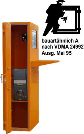
bauartähnlich A nach VDMA 24992 Ausg. Mai 95

Versicherungseinstufung: sprechen Sie mit Ihrer Versicherung. Bauartähnlich Sicherheitsstufe A nach VDMA 24992 Ausgabe Mai 95. Korpus 1-wandig 3 mm, Tür doppelwandig 70 mm, mit 3-seitiger Verriegelung über DB-Schloss mit 2 Schlüsseln. Serienmässige Lüftungsschlitze in der Tür mit Luftfilter vermeiden das Eindringen von Staub. Der serienmässige Ventilator (230 V) im oberen Bereich der Rückwand sorgt dafür, dass die warme Luft abgeführt und ein Überhitzen vermieden wird. Eine 3-fach Steckdose mit Kabelführung in der Seitenwand mit 2,5 m Länge nach aussen gehören ebenso zur Grundausrüstung des Schrankes, wie der 19 Zoll "touch screen" Monitor!!! Gegen Aufpreis auch mit Elektronikschloss 12 mm vorst. anstatt serienm. DB - Schloss möglich, Türöffnungswinkel 180°, 2 Bohrungen 11mm im Boden (Schrank muss verankert werden), Verankerungsmaterial gg. Mehrpreis - siehe Zubehör, Lackierung: RAL 7035 alternativ: RAL 2004 sonstige RAL-Farben gg. Aufpreis